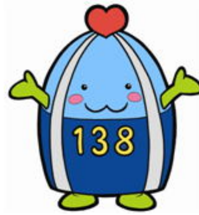
一宮市マスコットキャラクター「いちみん」